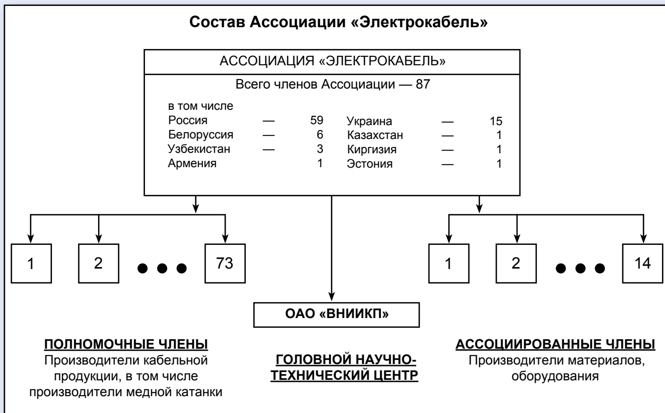
Рис. 1. Члены Ассоциации «Электрокабель» производят свыше 90 % кабельной продукции на территории СНГ

7. Организация повышения профессионального уровня специалистов и руководителей.